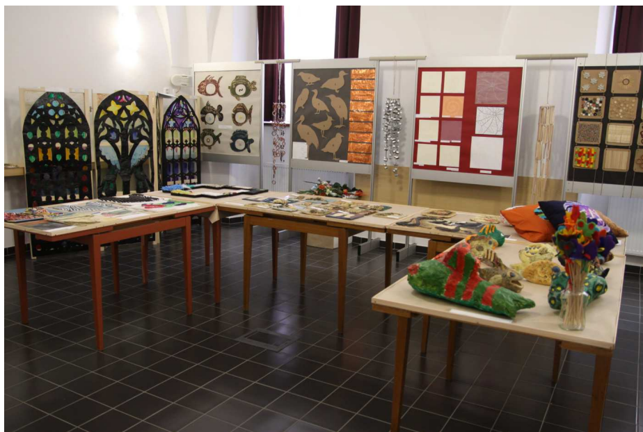
výstava v rámci výtvarného projektu Doteky