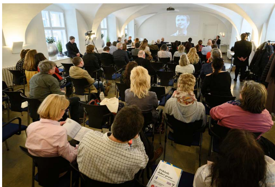
Závěrečná konference projektu únor 2020, Praha